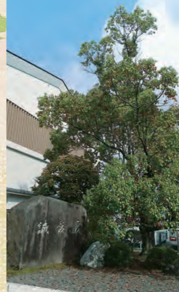
学校の木…樟(くすのき)

モラル、マナーを身につけるとともに、ルールを守るための意識の向上に力を入れています。人間性を高めることが高校生活の基本となります。