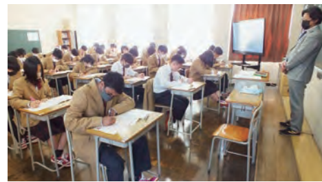
基礎力診断テスト

進学探究コースとキャリア探究コースでは、年3回、ベネッセコーポレーションの基礎力診断テスト（文科省「高校生のための学びの基礎診断」認定）を実施し、基礎学力の定着を図っています。また特別進学コースでは、ベネッセコーポレーションの進研模試や河合塾の全統模試を受験し、大学入学共通テスト及び国立大学入試に備えています。