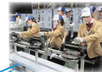
夢実現プロジェクト(企業訪問実習)